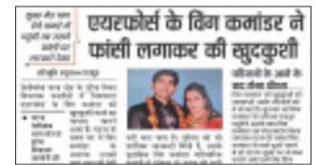
हरिभूमि न्यूज ▶▶ रायपुर

की चपेट में आ चुका है। सुबह दिन चढ़ने के साथ गर्मी अपना असर दिख रही है, जिससे देर रात होने के बाद ही राहत मिल रही है। पिछले तीन दिन से तो रायपुर, दुर्ग, राजनांदगांव के क्षेत्र लू की चपेट में है। सुबह 11 बजने तक 37 डिग्री तक पहुंचने वाला तापमान दोपहर तीन बजे तक 43-44 डिग्री तक पहुंच जा रहा है। शुक्रवार को त्वचा में जलन महसूस कराने वाले गर्मी ने लोगों को घर-दफ्तर के भीतर दुबकने को मजबूर कर दिया। शुक्रवार को राजनांदगांव का अधिकतम तापमान 44 डिग्री तक पहुंच गया। रायपुर में 42.8 डिग्री का पारा होने के बाद भी गर्मी ने अपना कहर बरपाने में कोई कोर-कसर बाकी नहीं छोड़ी। दोपहर होने के बाद सड़कों पर आवाजाही करने वाले लोग हेलमेट लगाने और स्कार्फ से लिपटे नजर आए। विधानसभा थाना क्षेत्र के गांव यानी राजधानी के आउटर में एक विधिपति महिला की भारी गर्मी की वजह से मौत हो गई।